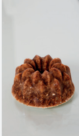
KÜCHENSEIFE ZIEGENMILCH, KAFFEE