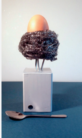
EIERBECHER HOLZ, METALL