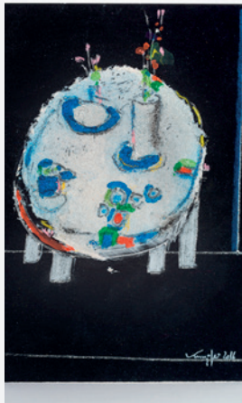
TEA FOR TWO KARTONRADIERUNG GEFÄRBELT