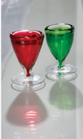
SHNAPSGLASSES IN COLOUR GLAS