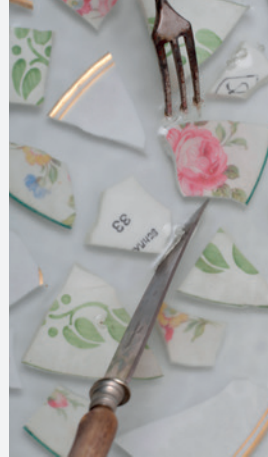
TELLERSÜLZE MIXED MEDIA